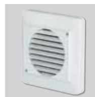
GR-100 Reja de plástico.