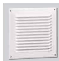
GRA-75 Reja exterior de aluminio.