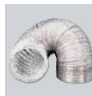
GSA-100 Conducto flexible de aluminio.